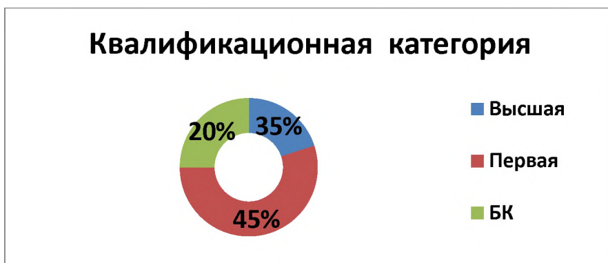
Диаграмма с характеристиками кадрового состава МБДОУ № 22

Курсы повышения квалификации в 2021 году прошли: заведующий, заместитель заведующего по ВМР, учитель-дефектолог-1; воспитатели - 8;